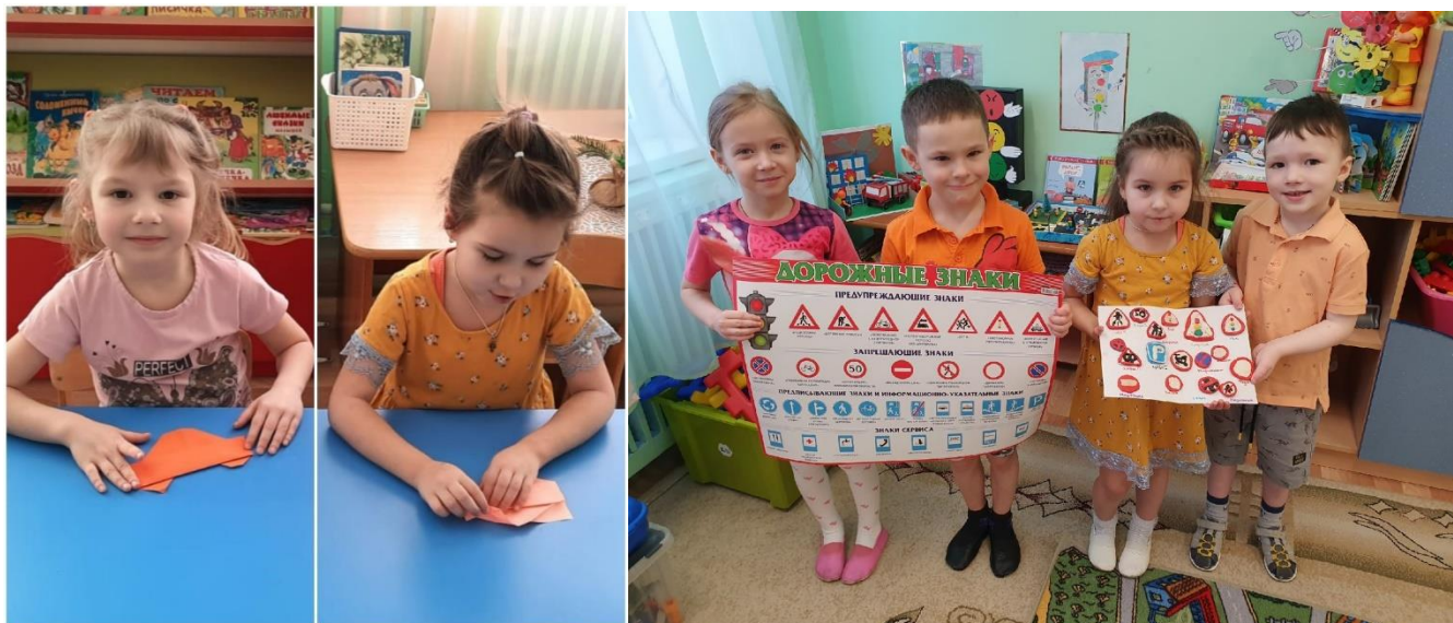
Лепка «Страна дорожных знаков».